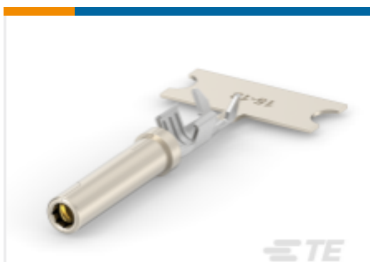
TE 产品编号1-2600021-5 XRC SOCKET 16-18 AWG Gold Plated