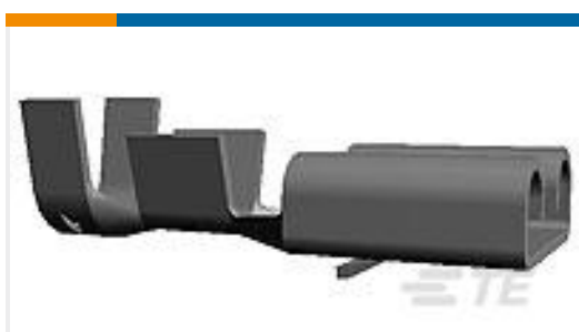
TE 产品编号60249-3 FF 250 REC 16-12AWG BR SILVER PLATED