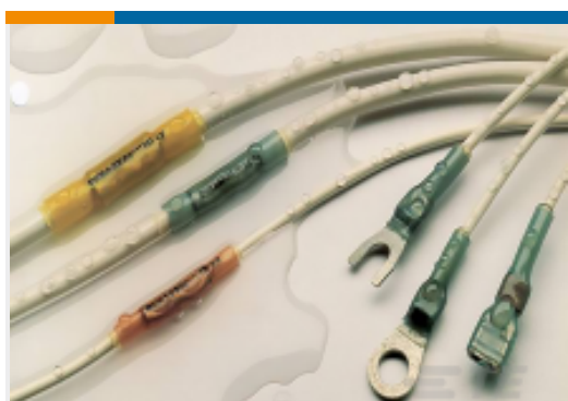
TE 产品编号157013-000 B-106-1502-S