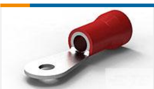
TE 产品编号52041-9 TERMINAL R PG 8 1/4