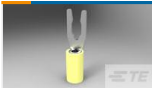
TE 产品编号52430-2 TERMINAL,PIDG SPR SPD 12-10 6