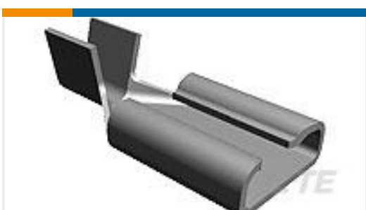
TE 产品编号61969-1 187 FASTON REC 20-16 AWG TPBR