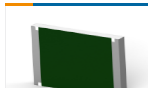
TE 产品编号1-2176408-1 3560 1K8 5%