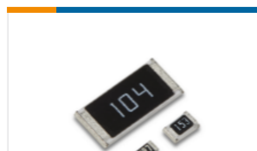
TE 产品编号6-2176339-1 CRGCQ 0603 1M0 1%