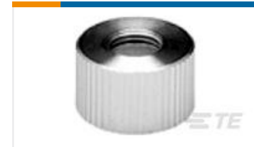
TE 产品编号8-1437627-4 G12KA=BUTTON GUARD KNURL ALUM