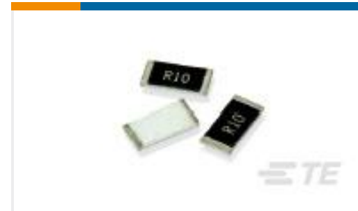
TE 产品编号3-1879463-4 RL73H 2E R24 1% 1K RL