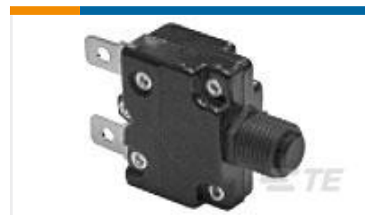
TE 产品编号9-1423364-7 W57-XB1A7A10-10=CKTBKR,THERM, PB,SCW/QC