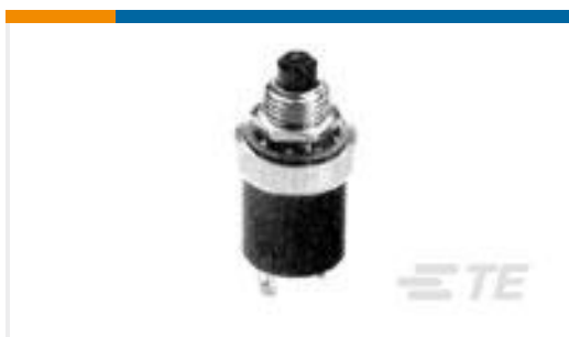
TE 产品编号1825516-1 MSP103B04