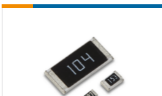
TE 产品编号6-2176337-1 CRGCQ 0402 1M0 1%