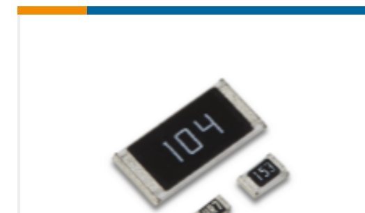
TE 产品编号1-2176337-4 CRGCQ 0402 120R 1%