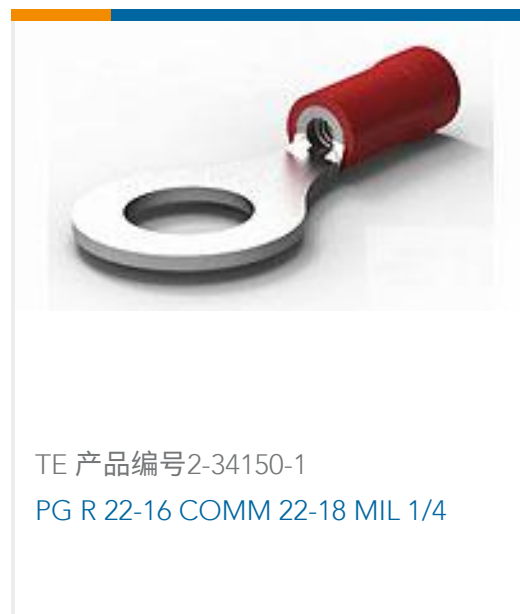
TE 产品编号2-34150-1 PG R 22-16 COMM 22-18 MIL 1/4