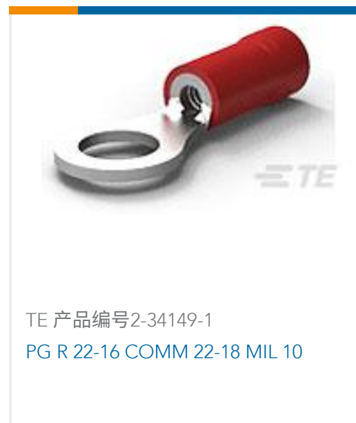
TE 产品编号2-34149-1 PG R 22-16 COMM 22-18 MIL 10