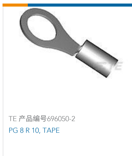
TE 产品编号696050-2 PG 8 R 10, TAPE