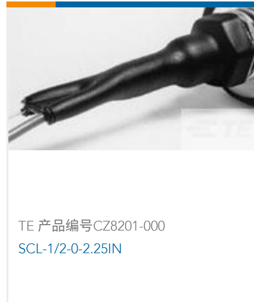
TE 产品编号CZ8201-000 SCL-1/2-0-2.25IN