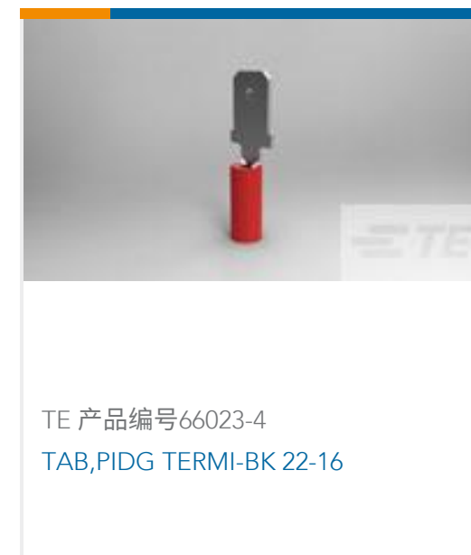
TE 产品编号66023-4 TAB,PIDG TERMI-BK 22-16