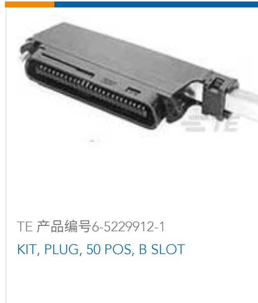
TE 产品编号6-5229912-1 KIT, PLUG, 50 POS, B SLOT