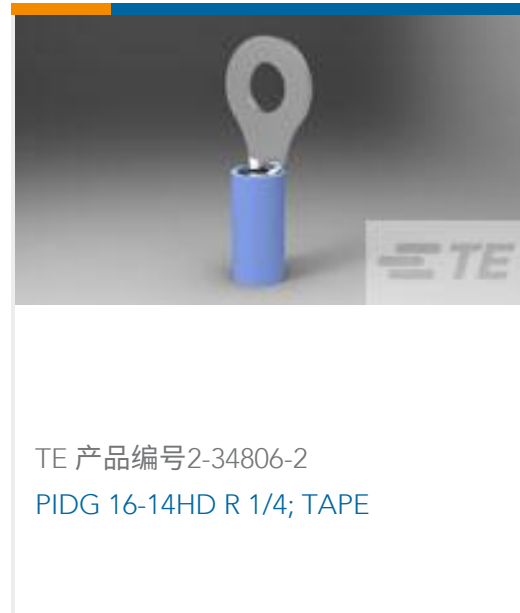
TE 产品编号2-34806-2 PIDG 16-14HD R 1/4; TAPE