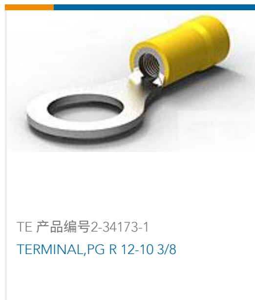
TE 产品编号2-34173-1 TERMINAL,PG R 12-10 3/8