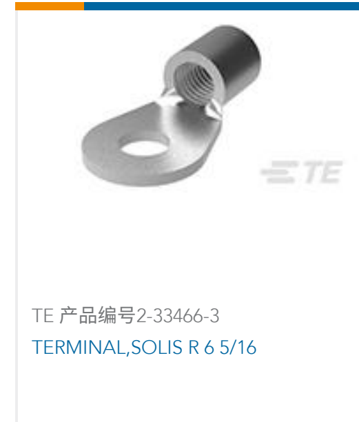
TE 产品编号2-33466-3 TERMINAL,SOLIS R 6 5/16