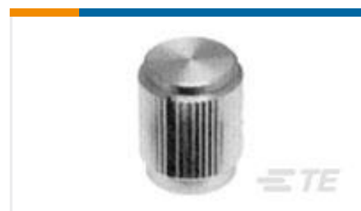
TE 产品编号4-1437622-6 KN500B1/4=KNOB BLACK KNURL 1/4