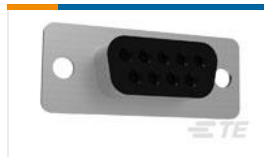
TE 产品编号205203-3 CRIMP SNAP RCPT ASSY,SIZE 1