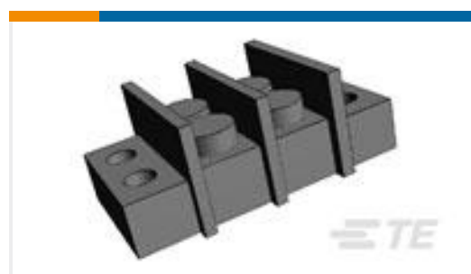
TE 产品编号1546306-2 2P .374" DR BARRIER STRIP