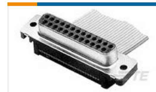
TE 产品编号1658610-3 15 POS HDF RCPT, MS, LEAD FREE