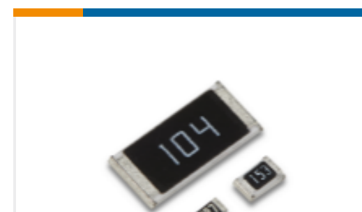
TE 产品编号3-2176343-4 CRGCQ 1206 5K6 1%