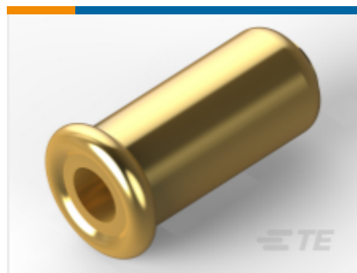
TE 产品编号 2-331677-9 SOCKET,MIN-SPR W/KO AU SER-3