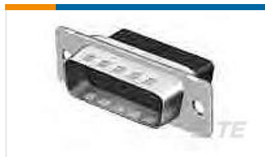
TE 产品编号5205208-1 CRIMP SNAP PLUG ASSY, 25 POS