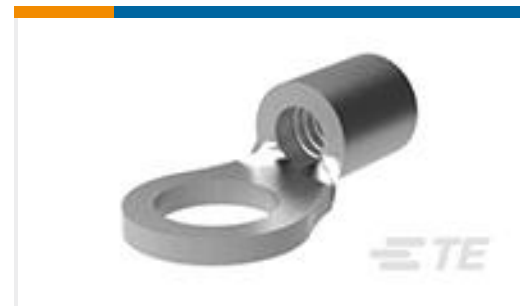
TE 产品编号2-33456-1 TERMINAL, SOLIS R 12-10 6