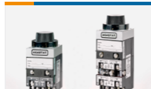
TE 产品编号3-1423159-2 7012PI=RLY, STD, ON, 2P, 125VDC, 60