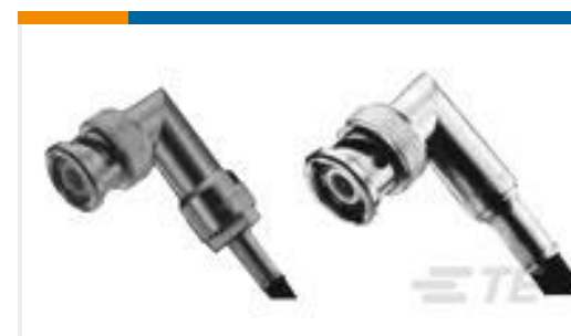
TE 产品编号5413959-1 PLUG RTANG BNC HEX 50 OHM