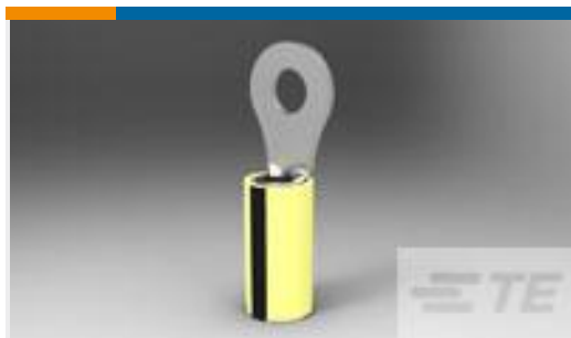
TE 产品编号35634 TERMINAL, PIDG R 16-14HD 6