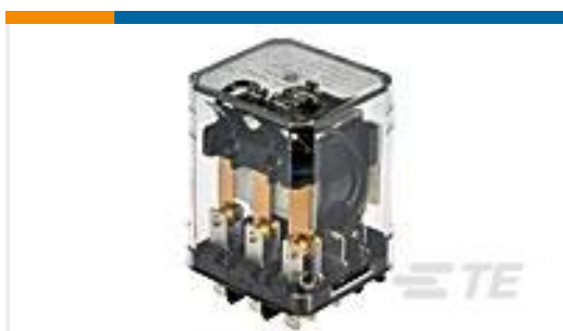
TE 产品编号1393118-8 KUP-14D11-110=KU