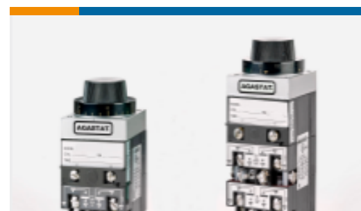
TE 产品编号1-1423165-1 7024JC=RLY, STD, OFF, 4P, 208VAC, 1