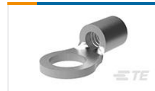
TE 产品编号8-32994-2 TERMINAL, SOLIS R 12-10 8