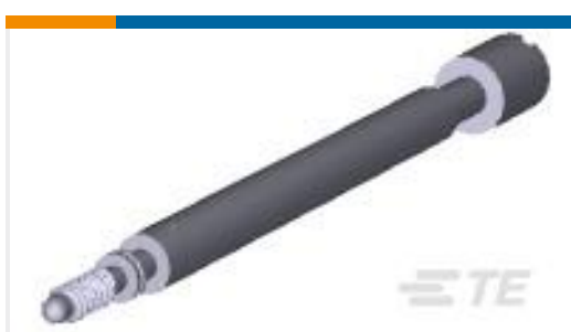
TE 产品编号201911-1 JACKSCREW KIT