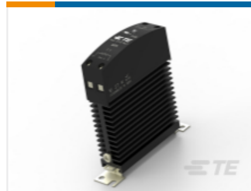
TE 产品编号9-1393030-3 SSRK-240A20 = DIN Rail MOUNT, 20A, 240V AC