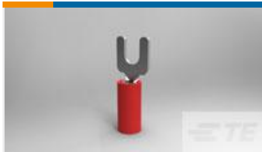
TE 产品编号34541 PIDG SPD 22-16 COMM 22-18MIL 6