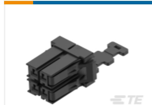
TE 产品编号1-2303376-1 D3200 FMLB REC STRAIN RELIEF KIT 4P RR