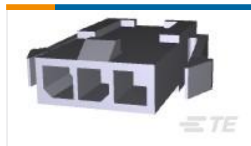
TE 产品编号1445048-3 PANEL MT SNGL ROW HSG 3 POS