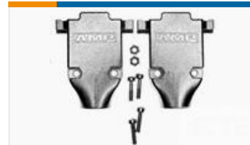
TE 产品编号5745173-2 CABLE CLAMP KIT, SZ 3