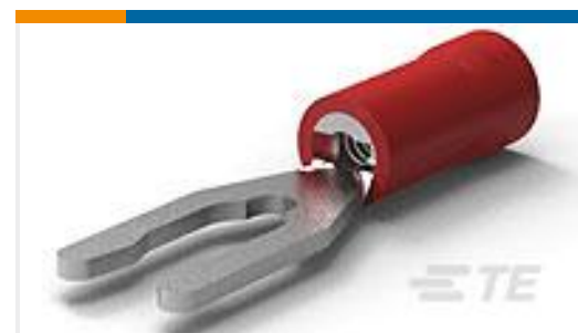
TE 产品编号52453-1 PG SPR SPD 22-16 COMM 22-18MIL 6