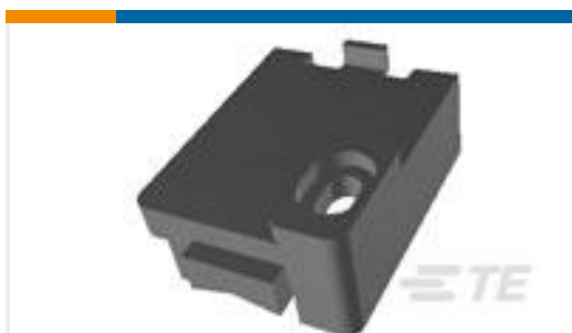
TE 产品编号640716-1 09P UMNL STR/REL & INSRT