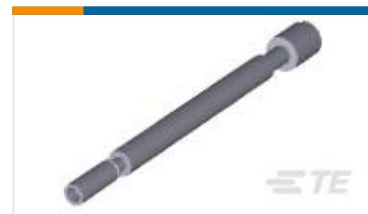
TE 产品编号201910-1 JACKSCREW KIT