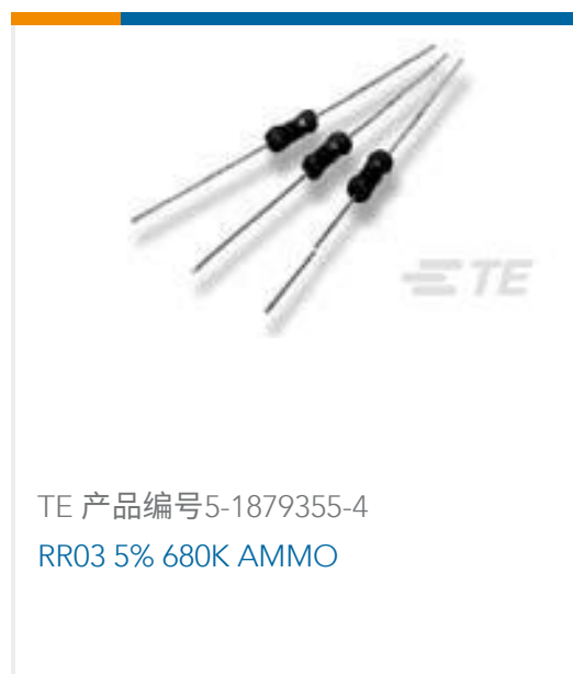
TE 产品编号5-1879355-4 RR03 5% 680K AMMO