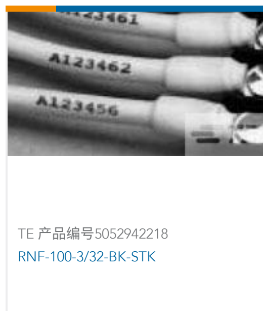
TE 产品编号5052942218 RNF-100-3/32-BK-STK