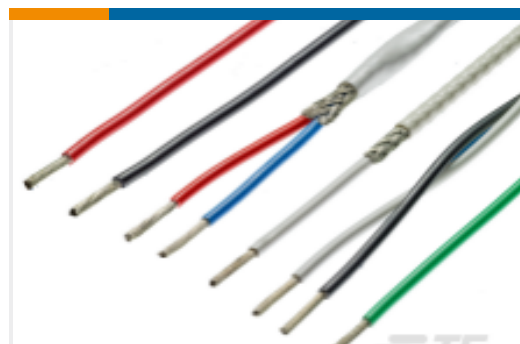
TE 产品编号877541-000 44AM1141-24-MST4-9CS2275