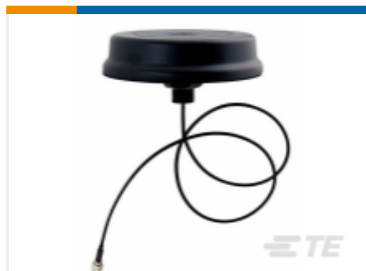
TE 产品编号LPS69273NT-61SMAM INFRA M2M,OMNI SISO 3G-4G, SMAM,RG316