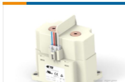
TE 产品编号2071568-2 ECP150BHBADA