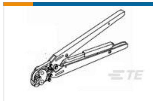
TE 产品编号47907-1 DAHT PIDG 24-20 ASSY