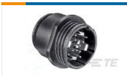
TE 产品编号206613-3 RECEPT SZ 23,CPC