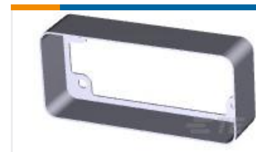
TE 产品编号202119-2 PIN HOOD