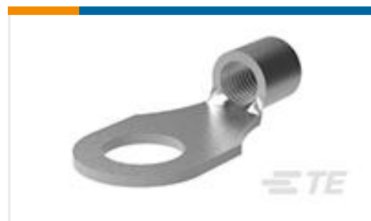
TE 产品编号36929 TERMINAL,SOLIS R 3/0 1/2