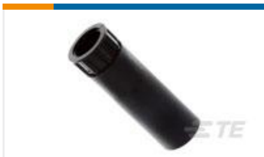
TE 产品编号54010-1 CPC STRAIN RELIEF,SIZE 11