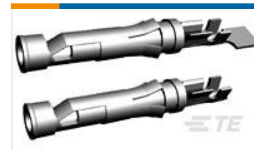
TE 产品编号1-66358-9 III+ SKT,18-14,30AU/FL,STRIP