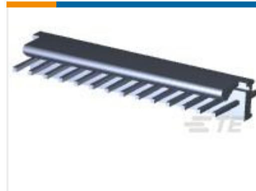
TE 产品编号1-640456-4 14P MTA100 HDR ASSY F/L SQ STR