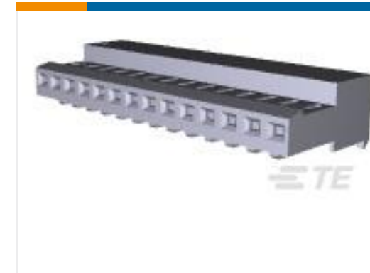
TE 产品编号4-640441-4 14P MTA100 CONN ASSY WHT