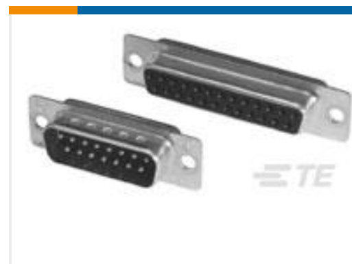
TE 产品编号5-747916-2 37 Plug Solder Cup, Gold Flash