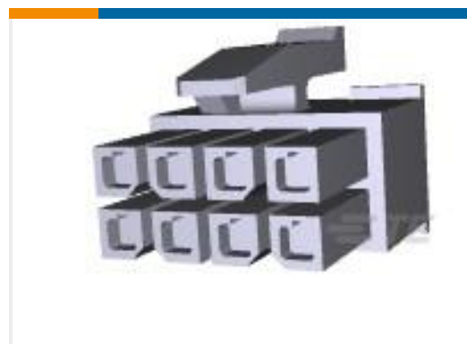
TE 产品编号794617-8 8POS,MICRO MNL,RCPT HSG