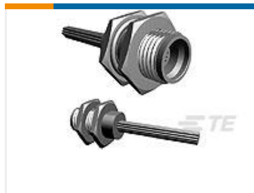
TE 产品编号1-1589061-3 QCM019SC2DMC30P = CIRCULAR