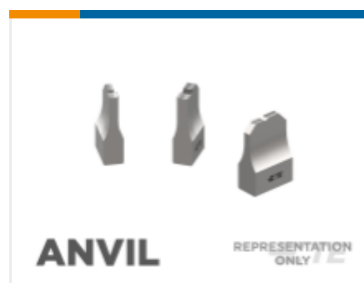
TE 产品编号1803122-1 ANVIL, COMBINATION