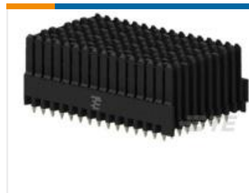
TE 产品编号1410964-1 MULTIGIG RT T2 .8" BP FULL CNT