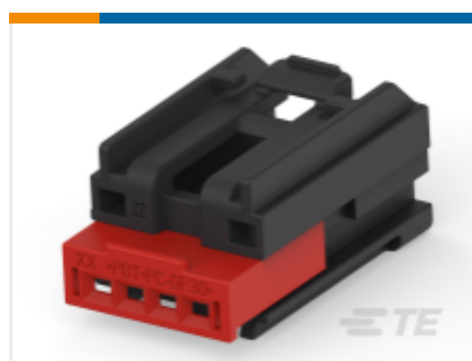
TE 产品编号1456983-5 1X4 Fem unsealed LP assy Key C