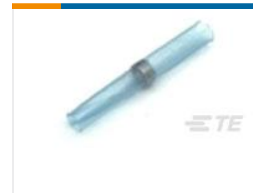
TE 产品编号625159-000 D-110-35