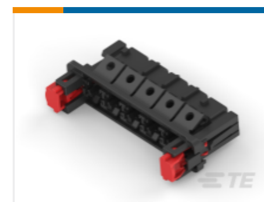
TE 产品编号2327450-1 5PORT,MATENET,REC HSG,COD A, SUBASSM