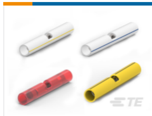
TE 产品编号2-320562-3 PIDG Butt Splices