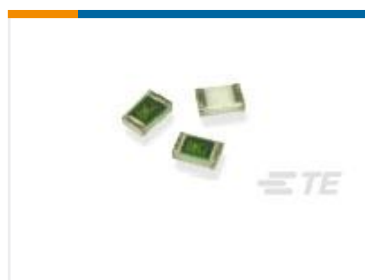
TE 产品编号6-2176091-3 RP 2A 0.25W 261R 0.1% 25PPM 1K RL