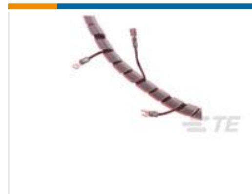
TE 产品编号500015-1 SPIRAP 1/4", NYLON, NAT, 50 FT