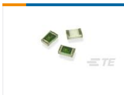
TE 产品编号7-2176092-3 RP 2A 0.25W 4K32 0.1% 25PPM 1K RL