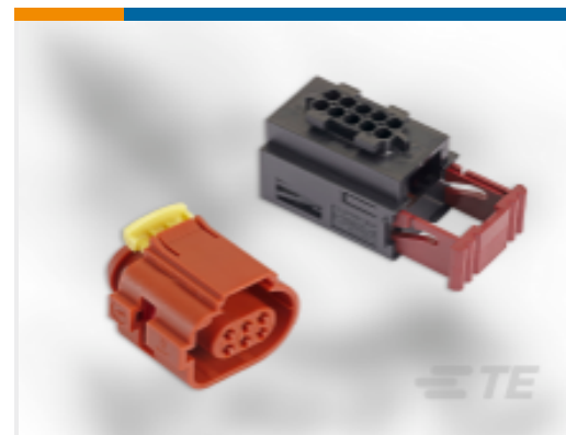
TE 产品编号1718878-2 Timer Connector Housing