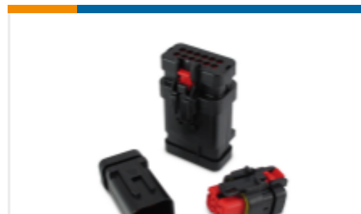
TE 产品编号776428-3 AMPSEAL 16 Housings