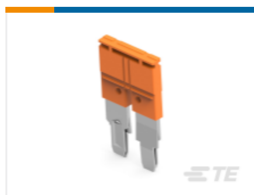
TE 产品编号1SNK910302R0000 JB10-2