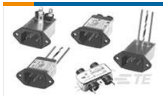
TE 产品编号6609012-3 6EH1=F7286 S0