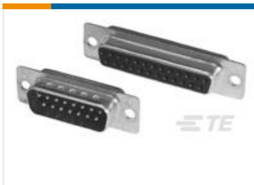
TE 产品编号5-747913-2 25 Rcpt Solder Cup, Gold Flash