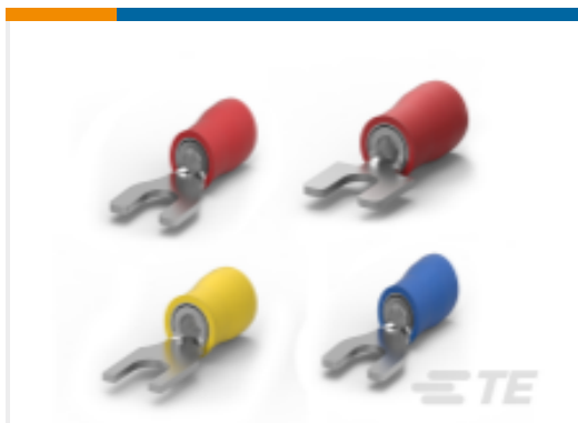
TE 产品编号2-321233-1 PIDG Spade Tongue Terminals