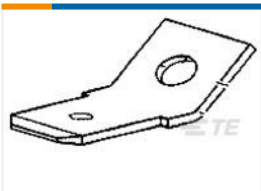
TE 产品编号60465-2 250 FASTON TAB TPBR