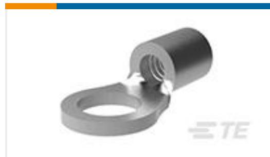
TE 产品编号2-34103-1 SOLIS R 22-16 COMM 22-18 MIL 2