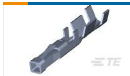
TE 产品编号1-794606-1 MICRO MNL RPT CNT STRP 15AU LF