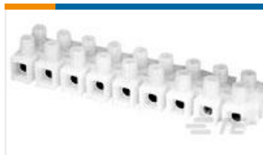
TE 产品编号1-1776313-2 TSB200012DS=EUROPA T-BL,14.5MM