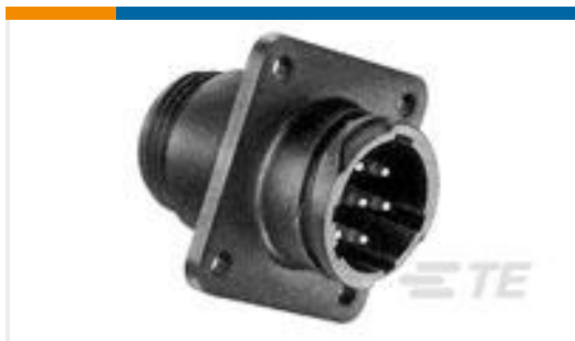
TE 产品编号211401-8 RECEIPT,SZ 13-7,CPC