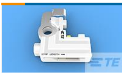
TE 产品编号2-2154857-2 Socket, SCALABLE LED, 2PC, Gold, w /TS