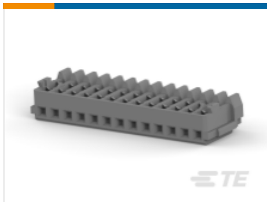
TE 产品编号 1-353293-3 MINI CT MT REC ASSY 13P GRAY