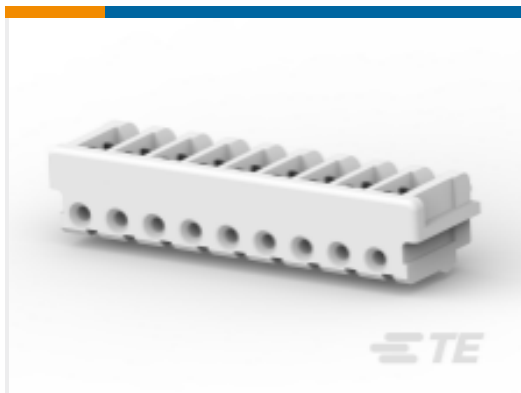
TE 产品编号 CAT-AM7017-H8172 AMP 通用终端壳体