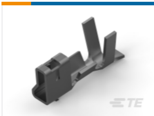
TE 产品编号 CAT-AM7017-C7671 Common Termination Contacts — POWER TRIPLE LOCK