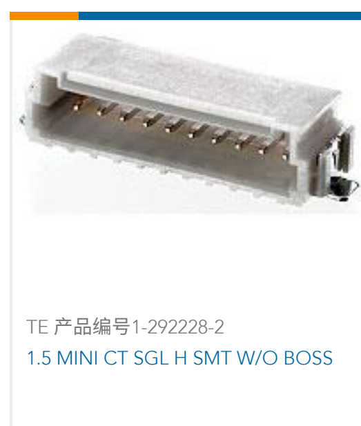
TE 产品编号1-292228-2 1.5 MINI CT SGL H SMT W/O BOSS