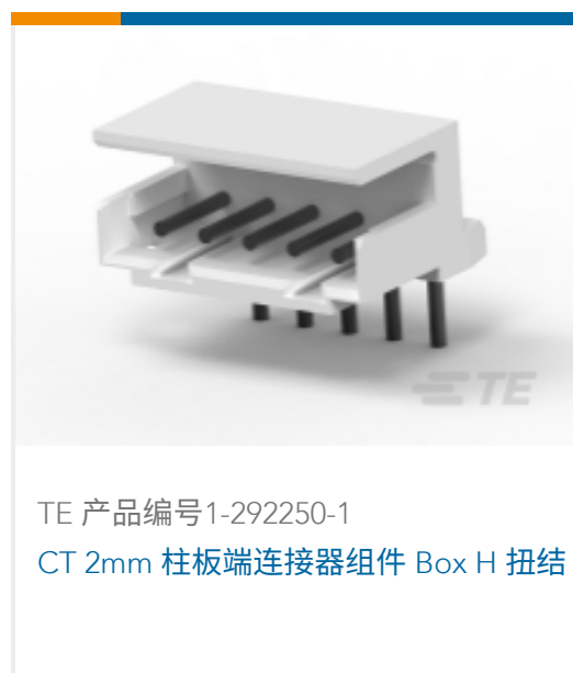
TE 产品编号1-292250-1 CT 2mm 柱端连接器组件 Box H 扭结