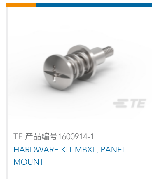
TE 产品编号1600914-1 HARDWARE KIT MBXL, PANEL MOUNT