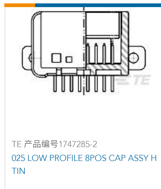
TE 产品编号1747285-2 025 LOW PROFILE 8POS CAP ASSY H TIN