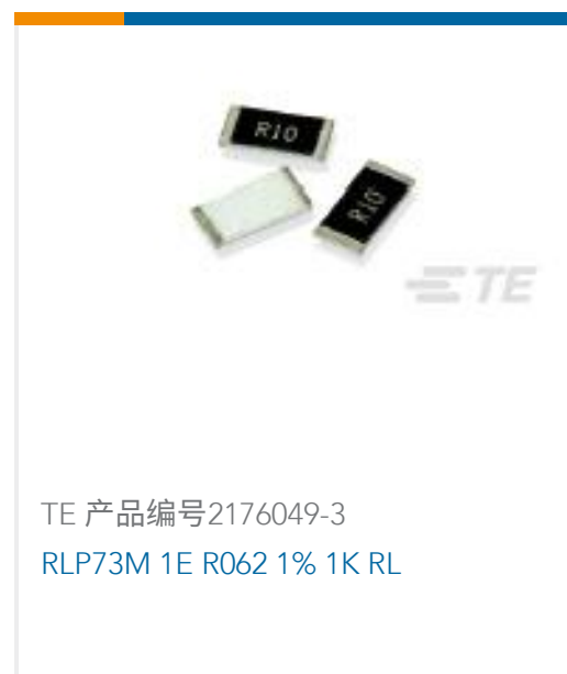
TE 产品编号2176049-3 RLP73M 1E R062 1% 1K RL