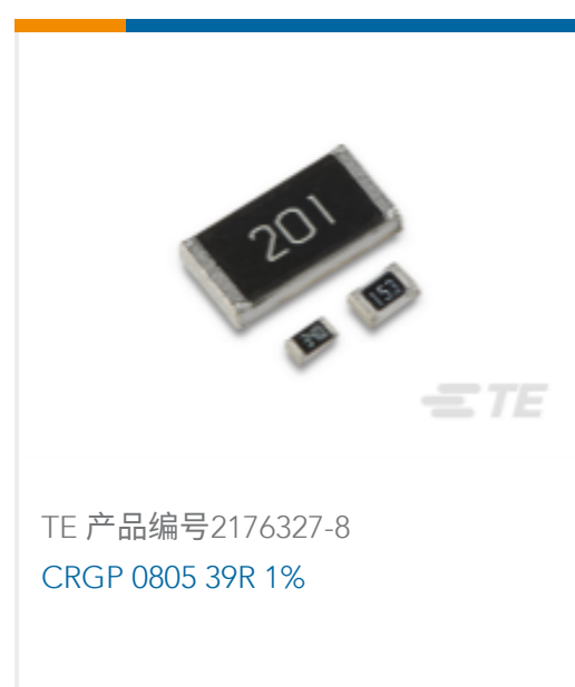
TE 产品编号2176327-8 CRGP 0805 39R 1%