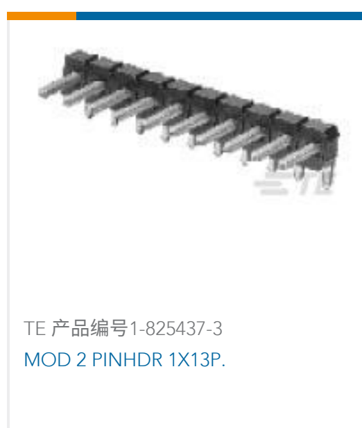
TE 产品编号1-825437-3 MOD 2 PINHDR 1X13P.