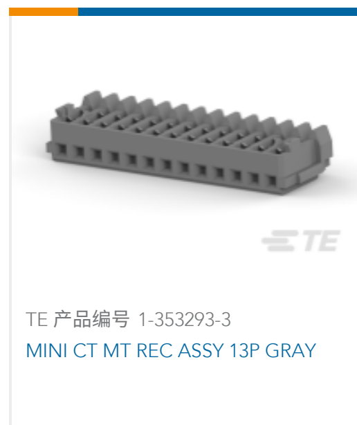
TE 产品编号 1-353293-3 MINI CT MT REC ASSY 13P GRAY