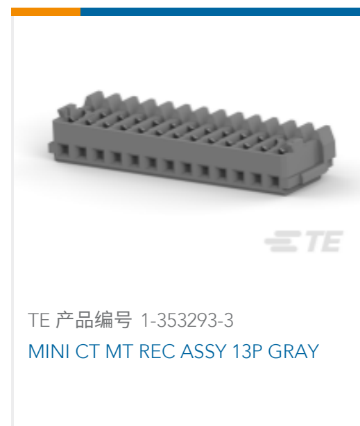
TE 产品编号 1-353293-3 MINI CT MT REC ASSY 13P GRAY