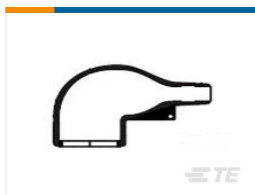
TE 产品编号EF9981-000 222K121-25L/225-0