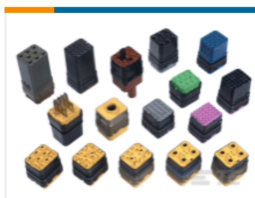
TE 产品编号ZPF000000000148762 DMC-M 99-04 AN (=33537-P0000)