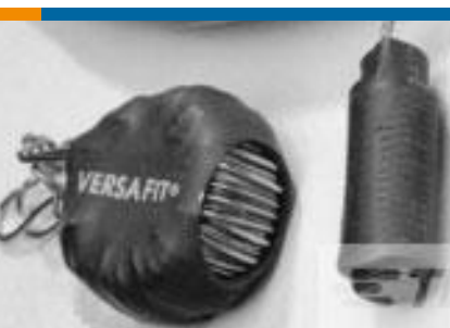
TE 产品编号CZ8200-000 VERSAFIT-3/4-0-2.25IN