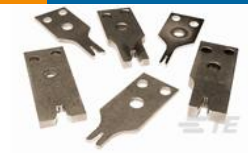
TE 产品编号6-456134-7 CRIMPER, INSULATION "F"(.210")