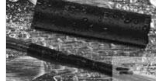
TE 产品编号121397P013 ES2000-NO.3-B8-0-41MM