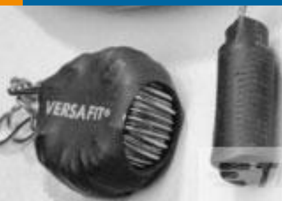
TE 产品编号CZ8200-000 VERSAFIT-3/4-0-2.25IN