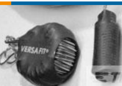
TE 产品编号CZ8200-000 VERSAFIT-3/4-0-2.25IN