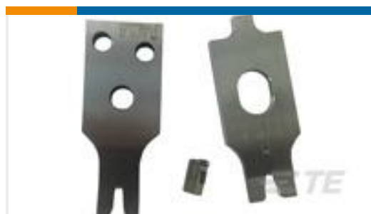
TE 产品编号7-2151500-7 OCEAN_2.0_SPARE_PART_KIT-090F130F