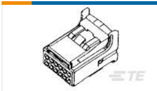
TE 产品编号1376675-1 025 PLUG HSG ASSY S/BODY 12P