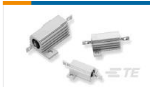
TE 产品编号1-1879363-4 THS75 330R 5%