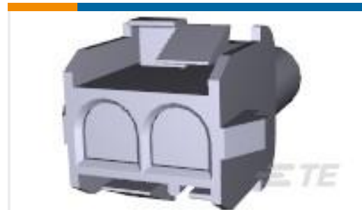
TE 产品编号1-480699-9 02P UMNL CAP HSG BLK