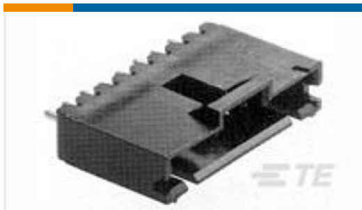
TE 产品编号5-104363-1 02 MTE HDR SRST LATCH .100CL