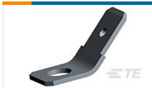
TE 产品编号140814-1 250 FASTON,TAB,BR