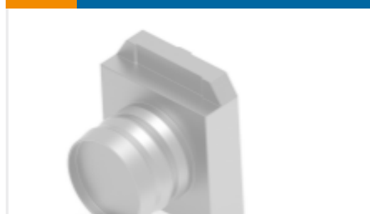
TE 产品编号2-2308348-4 CRIMP FLANGE 14 LARGE