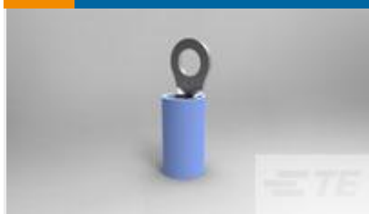
TE 产品编号2-320619-1 TERMINAL,PIDG R 16-14 6