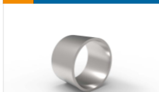
TE 产品编号3-2308350-1 Crimp Barrel for D-Sub Connectors