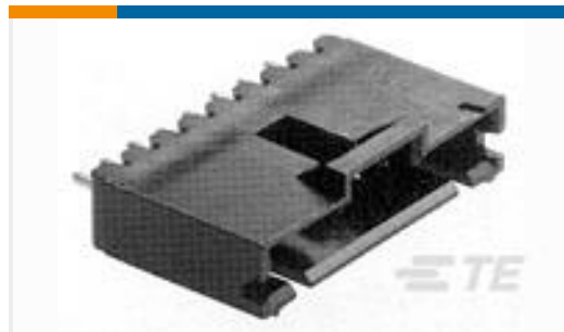
TE 产品编号5-104363-1 02 MTE HDR SRST LATCH .100CL