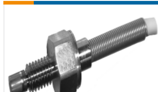
TE 产品编号EXP5-1KPS-C00001 XP5-X-1KPS