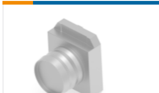
TE 产品编号2-2308348-5 CRIMP FLANGE 15 LARGE