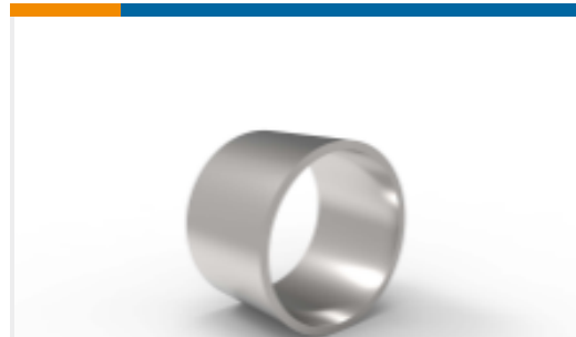
TE 产品编号3-2308350-1 Crimp Barrel for D-Sub Connectors