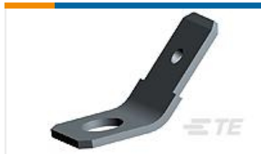
TE 产品编号140814-1 250 FASTON,TAB,BR