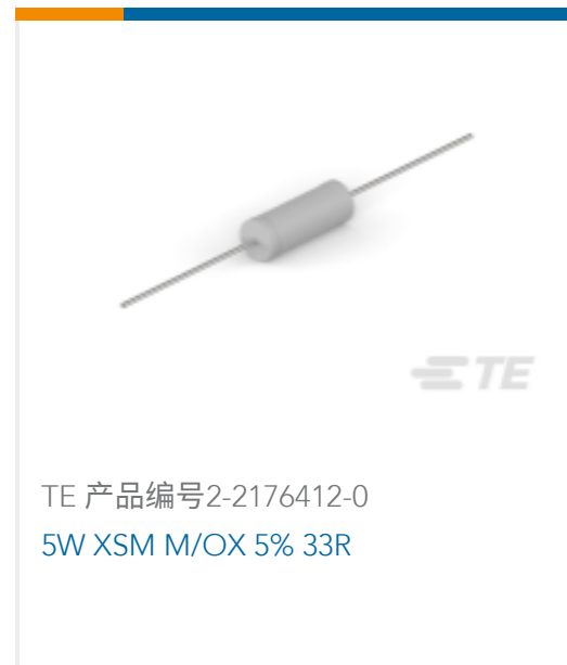
TE 产品编号2-2176412-0 5W XSM M/OX 5% 33R