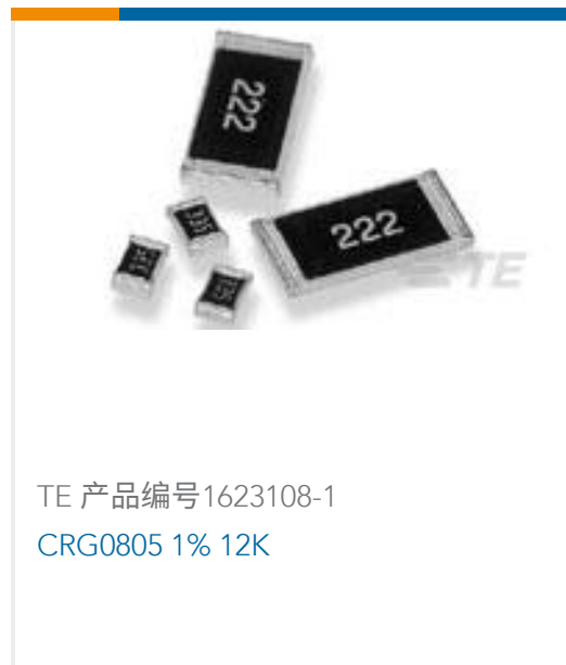
TE 产品编号1623108-1 CRG0805 1% 12K