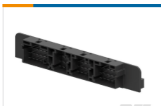
TE 产品编号1376113-5 High Pin Count Header