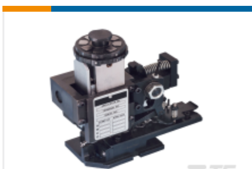
TE 产品编号680588-3 HDM 9HBAPR140S140OG