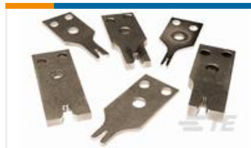
TE 产品编号6-456134-7 CRIMPER, INSULATION "F"(.210")