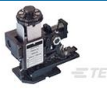
TE 产品编号567408-2 HDMHB 9EAPR160T180O G