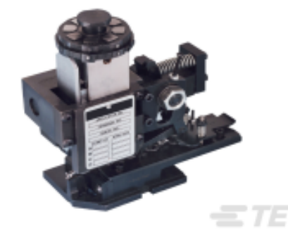
TE 产品编号680588-3 HDM 9HBAPR140S140OG