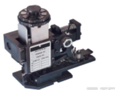
TE 产品编号680588-3 HDM 9HBAPR14051400G