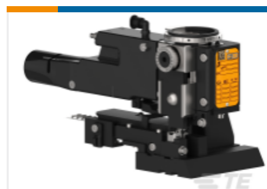
TE 产品编号2-2266918-2 OC-PA-S-FA-120F170F-059-0303