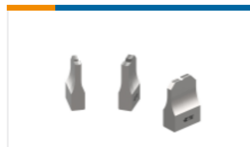
TE 产品编号4-1633917-8 ANVIL, COMBINATION