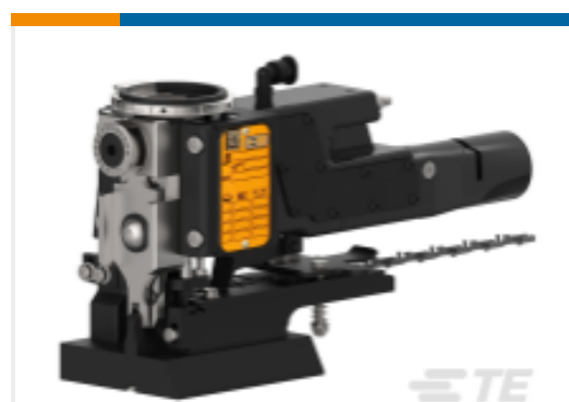
TE 产品编号2-2150597-2 OC-PA-E-FA-120F230F-059-0307