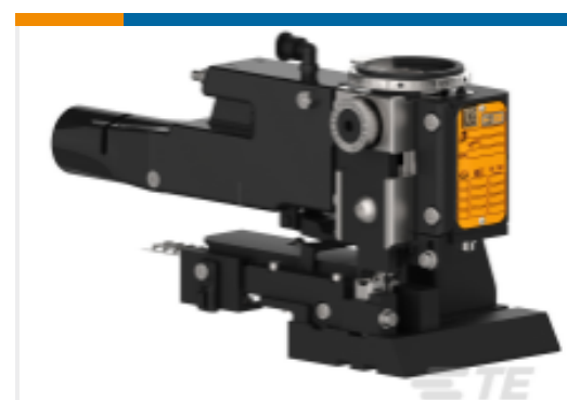
TE 产品编号2-2266914-2 OC-PA-S-FA-130F170OV-059-1104