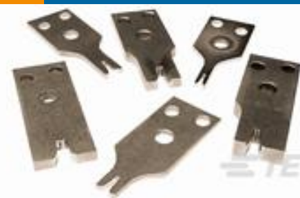
TE 产品编号6-1424909-6 CRIMPER, INSULATION "F"(.240")