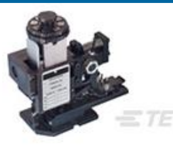
TE 产品编号567408-2 HDMHB 9EAPR160T180O G