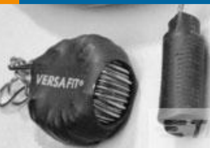
TE 产品编号CZ8200-000 VERSAFIT-3/4-0-2.25IN