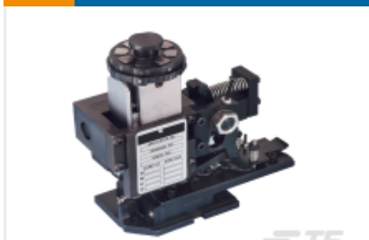
TE 产品编号680588-3 HDM 9HBAPR1405140OG