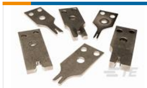
TE 产品编号6-1424909-6 CRIMPER, INSULATION "F"(.240")