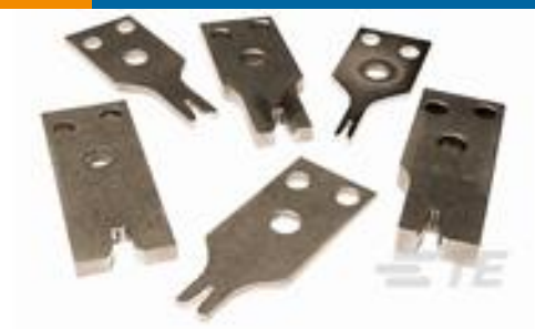
TE 产品编号6-1424909-6 CRIMPER, INSULATION "F"(.240")