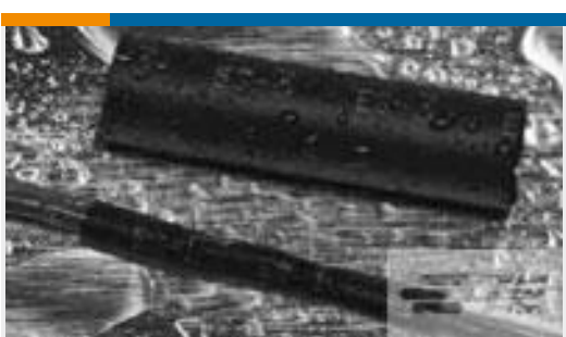
TE 产品编号121397P013 ES2000-NO.3-B8-0-41MM