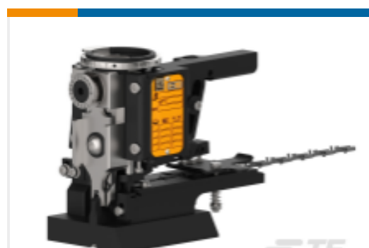
TE 产品编号2-2150173-1 OC-PA-E-FM-110F160F-059-1104