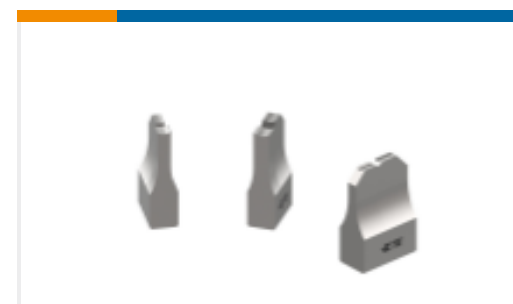
TE 产品编号4-1633917-8 ANVIL, COMBINATION