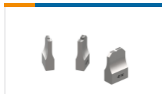
TE 产品编号1803010-6 ANVIL, SPECIAL, COMBINATION