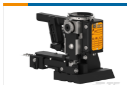
TE 产品编号2-2151398-1 OC-PA-S-FM-092F1150V-068-1159