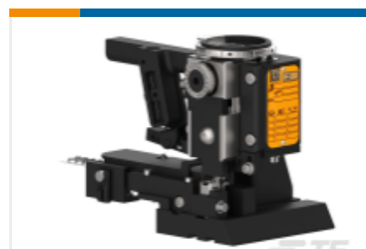
TE 产品编号2-2266925-1 OCEAN_2.0_APPLICATOR-S-070F100F