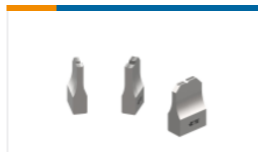
TE 产品编号1803010-7 ANVIL, SPECIAL, COMBINATION