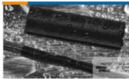
TE 产品编号CX2740-000 ES2000-NO.3-B8-0-130MM