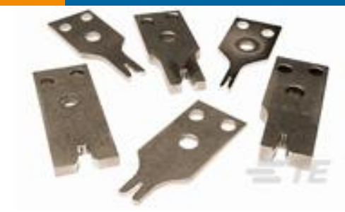
TE 产品编号6-456134-7 CRIMPER, INSULATION "F"(.210")