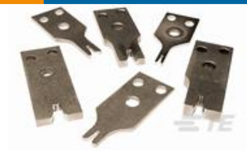
TE 产品编号6-1424909-6 CRIMPER, INSULATION "F"(.240")