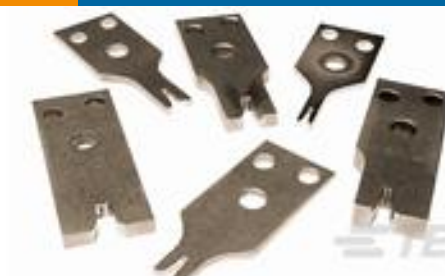
TE 产品编号6-456134-7 CRIMPER, INSULATION "F"(.210")