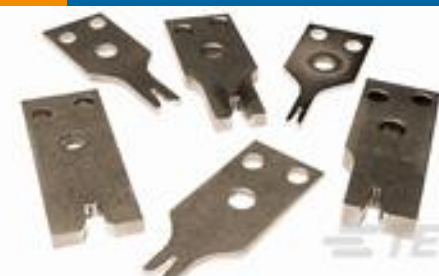
TE 产品编号6-1424909-6 CRIMPER, INSULATION "F"(.240")