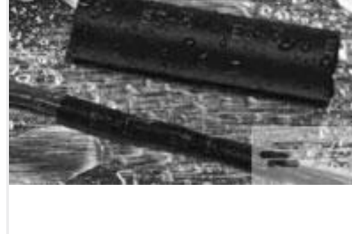
TE 产品编号CX2740-000 ES2000-NO.3-B8-0-130MM