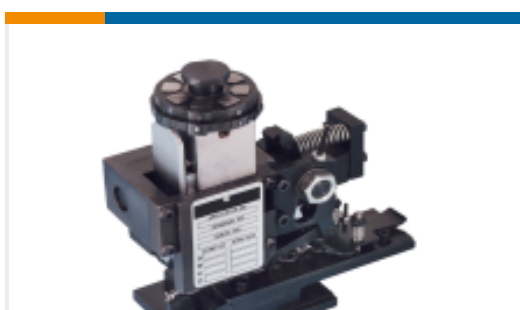
TE 产品编号680588-3 HDM 9HBAPR140S140OG