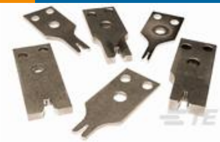
TE 产品编号6-456134-7 CRIMPER, INSULATION "F"(.210")