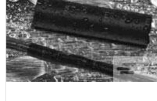
TE 产品编号121397P013 ES2000-NO.3-B8-0-41MM