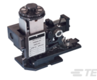
TE 产品编号680588-3 HDM 9HBAPR140S140OG