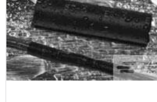
TE 产品编号121397P013 ES2000-NO.3-B8-0-41MM