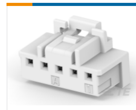
TE 产品编号 1-2232979-5 SGI2.0 PLUG ASSEMBLY 5P, KEY A, NTL