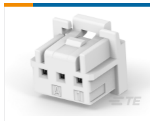
TE 产品编号 1-2232979-3 SGI2.0 PLUG ASSEMBLY 3P, KEY A, NTL