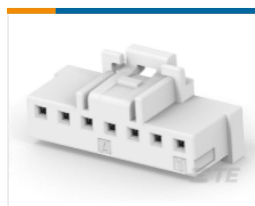
TE 产品编号 1-2232979-7 SGI2.0 PLUG ASSEMBLY 7P, KEY A, NTL