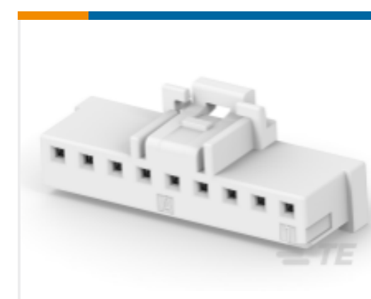
TE 产品编号 1-2232979-9 SGI2.0 PLUG ASSEMBLY 9P, KEY A, NTL