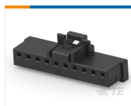
TE 产品编号 5-2232979-0 SGI2.0 PLUG ASSEMBLY 10P, KEY B, BLK