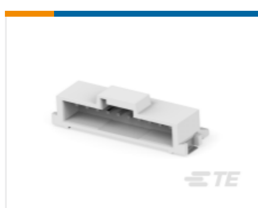
TE 产品编号 2-2336678-0 SGI2.0 RA SMT HDR ASSY 10P, key A, NTL