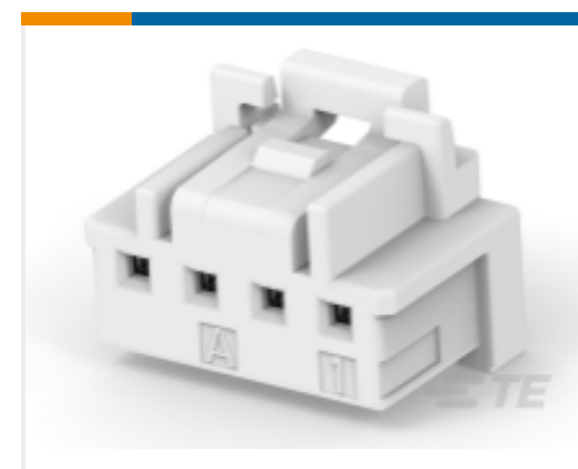
TE 产品编号 1-2232979-4 SGI2.0 PLUG ASSEMBLY 4P, KEY A, NTL