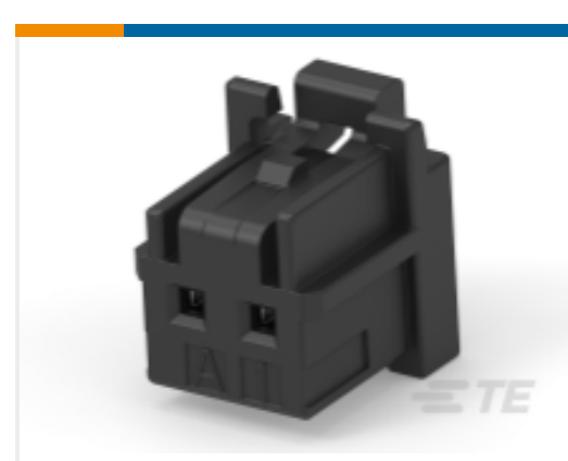
TE 产品编号 4-2232979-2 SGI2.0 PLUG ASSEMBLY 2P, KEY B, BLK