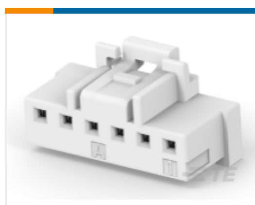
TE 产品编号 1-2232979-6 SGI2.0 PLUG ASSEMBLY 6P, KEY A, NTL