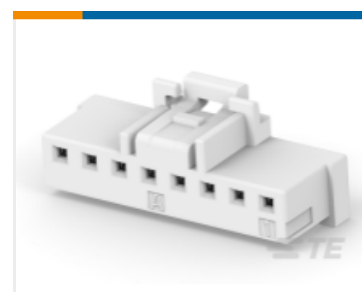
TE 产品编号 1-2232979-8 SGI2.0 PLUG ASSEMBLY 8P, KEY A, NTL