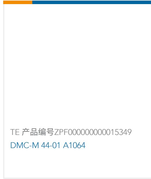
TE 产品编号ZPF000000000015349 DMC-M 44-01 A1064