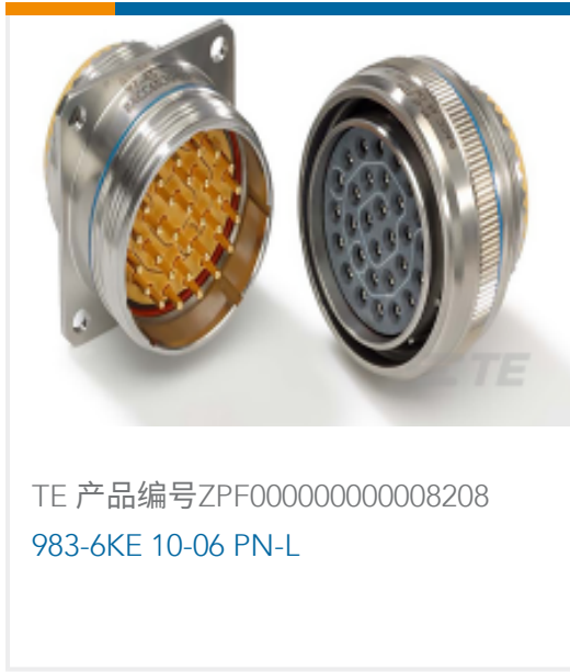
TE 产品编号ZPF000000000008208 983-6KE 10-06 PN-L