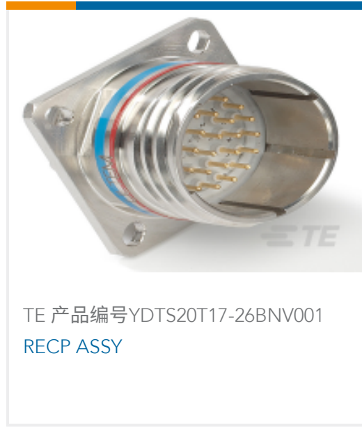
TE 产品编号YDTS20T17-26BNV001 RECP ASSY