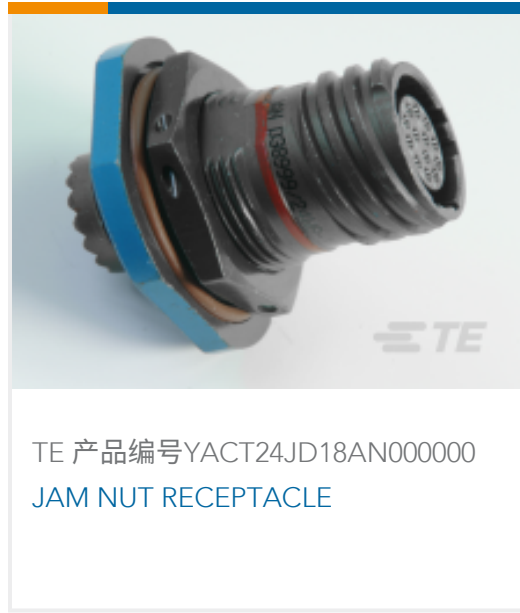
TE 产品编号YACT24JD18AN000000 JAM NUT RECEPTACLE