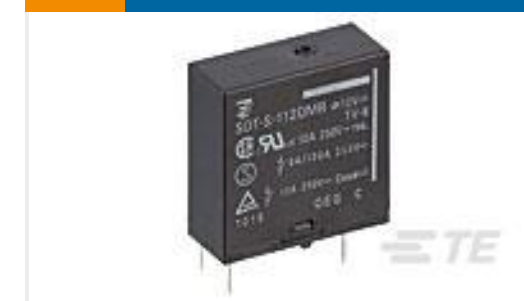
TE 产品编号8-1419125-5 SDT-S-106LMR,000