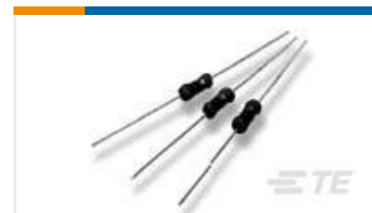
TE 产品编号4-1879350-2 RR01 5% 11R AMMO