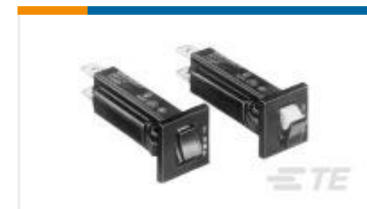
TE 产品编号1-1393250-7 W28-XQAT-15=W28