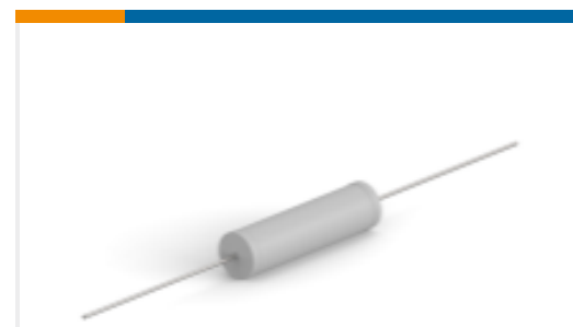
TE 产品编号4-2176414-8 7W STD M/OX 5% 1K8