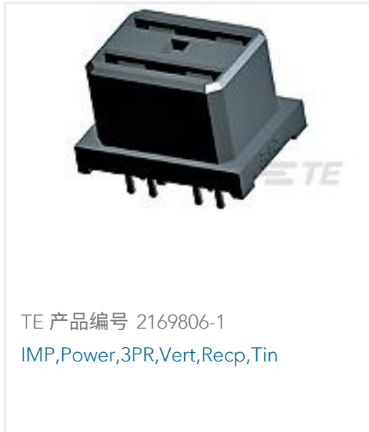
TE 产品编号 2169806-1 IMP,Power,3PR,Vert,Recp,Tin